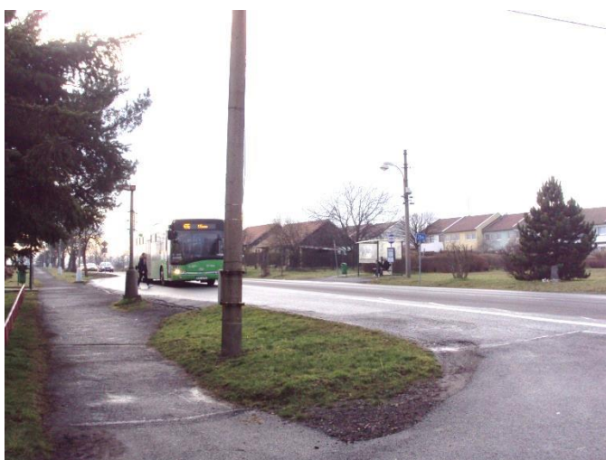
Stav před rekonstrukcí ...

Ze jmenovaných akcí je dokončena celková rekonstrukce zastávek na Teplické ulici a tím dořešena problematika dopravy a ochrany chodců na Teplické ulici. Byla provedena oprava některých stávajících chodníků a výstavba nových včetně míst pro přecházení a instalace nového osvětlení. Toto řešení naplňuje požadavky bezpečnostních auditů. Opravené jsou i obě čekárny.